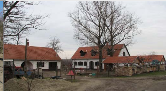
Egyéni tanyagazdaságok fejlesztése, induló tanyagazdaságok támogatása