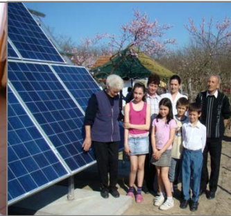
Villany nélküli tanyák villamosítása