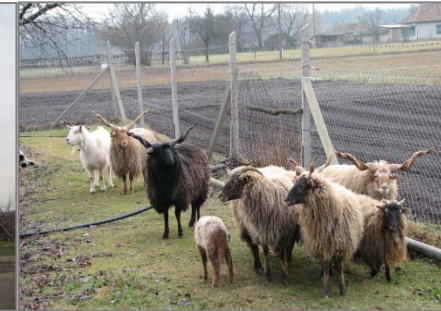
Őshonos állat- és növényfajták újbóli termelésbe vonása