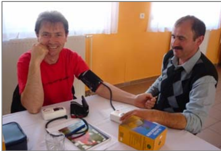
Tanyagondnoki szolgálatok megerősítése

1440 nyertes pályázat támogatása valósult meg